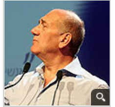
אבי מוכיחים שתרומה היא שוחד?

עוד מציין סמו, כי כפי שקורה פעמים רבות בחקירות שוחד - החוקרים יוצאים מנקודת הנחה כי החשוד לא יסמוך פרטים שיפילו אותו ולכן יש צורך באיסוף ראיות פוזיטיביות. "כך, למשל, אם החוקרים בפרשיית הולילנד יגלו כי יזמי הולילנד מעולם לא