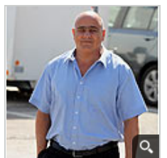
הכסף הלבן הפך לשחור. דנקנר