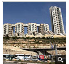
שני הצדדים נהנים