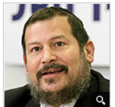
בקוץ הזה נדבר על שוחד