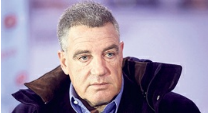
אסור לעבור על זה בשתיקה: משפחת עופר, גרסת הסנדק 22:33 אדריאן פילוט