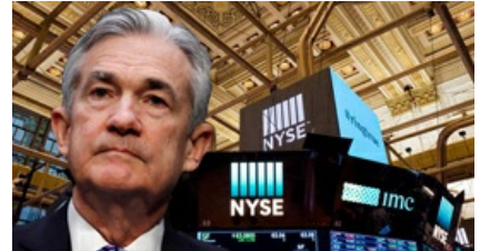
פאוול שלח את וול סטריט לעליות; נאסד"ק טיפס ב-2.6%