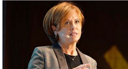
רוסק עמינח על המערכת הבנקאית: "הדיגיטל זו רק עטיפה למערכות ליבה מיושנות"