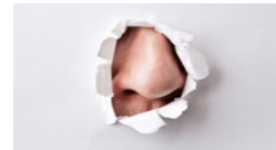
שדים וריחות: מה עושה הריח לזכרונות שלנו