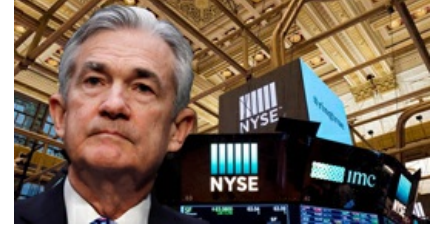
פאוול שלח את וול סטריט לעליות; נאסד"ק טיפס ב-2.6% 23:03 כתבי שוק ההון