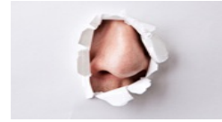
שדים וריחות: מה עושה הריח לזכרונות שלנו