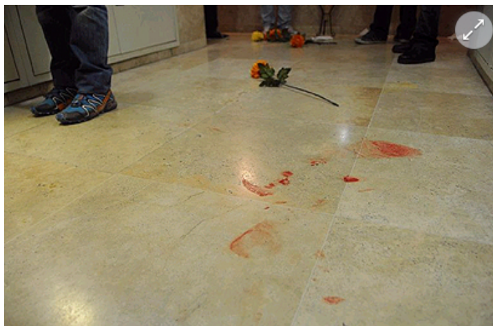
זירת האירוע בבניין בבת ים

על פי חומר הראיות, נכתב בהודעה, "במהלך הניסיון לעצור את החשוד, הוא תקף את השוטרים והם נאלצו לעשות שימוש בגז פלפל כדי לנטרלו. מאחר שזירת האירוע הייתה חדר מדרגות בבניין מגורים רב קומות, נפגעו גם השוטרים עצמם מן הגז. למרות השימוש בגז, החשוד לא נטרל ושב ותקף שוטר, בעוד האחרון פגוע משאיפת הגז. בשלב זה ביצע השוטר שימוש בנשקו, ירה כדור בודד לעבר החשוד ונטרל אותו".