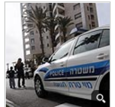
הבניין ברחוב יוספטל בבת ים

"על פי ממצאי החקירה, האירוע החל בדיווח שנתקבל במשטרה ממכריו של האזרח ההולנדי, אשר חששו מפגיעתו והזעיקו משטרה, תוך שהם מדווחים לשוטרים כי מדובר באדם אלים ומסוכן, חזק מאוד מבחינה פיזית, הנחה להיות במצב פסיכוסטי ומאיים ברצח", נכתב בהודעת מח"ש.