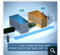
מרשם האוכלוסין - חקירת הפרשה