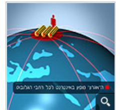
המידע דלף ברשת