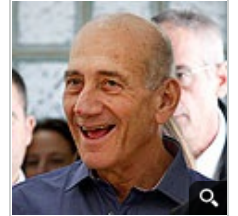
אולמרט לאחר הזיכוי