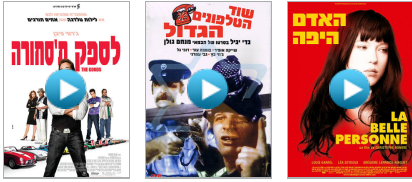
האדם היפה שוד הטלפונים לספק