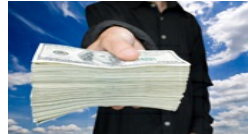
כך נולד הקרב על העושר שעשוי לשנות את העולם