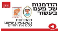
ההחלטות הפיננסיות שישנו לכם את החיים