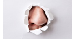
שדים וריחות: מה עושה הריח לזכרונות שלנו