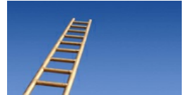
מיוחד: 50 הסטארטאפים המבטיחים של 2019