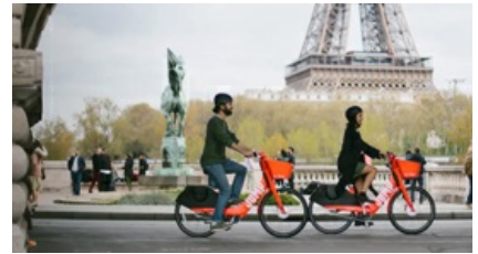
צרפת: 500 יורו במחנה למי שיקנה אופניים חשמליים 21:04 שירות כלכליסט