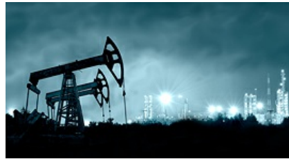
הנפט זינק ב-15%, מניית שברון קפצה ב-2.2% 23:01 כתבי שוק ההון