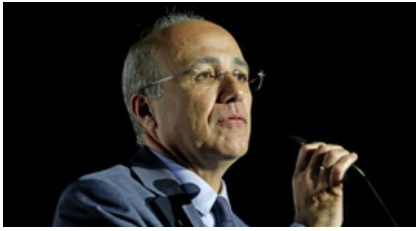
ברקת מוזק את הרפורמה בביטוחי הבריאות הפרטיים 06:44 אדריאן פילוט