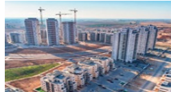
מגזין נדל"ן: הכירו את שכונות הרפאים בפריפריה