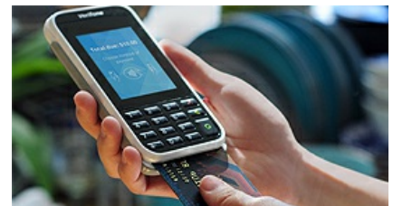
ביט, פפר פיי ופייבוקס רוצות להחליף את כרטיסי האשראי בסופר־פארם 06:56 רחלי בינדמן