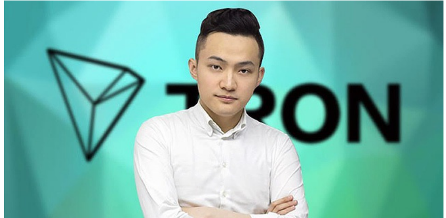
זה האיש ששילם 4.6 מיליון דולר עבור ארוחה עם וורן באפט 11:11 שירות כלכליסט