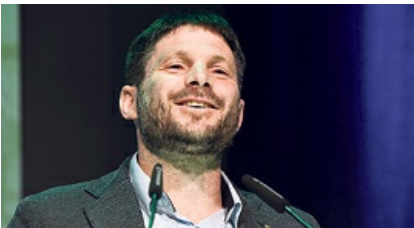
משילות, הדור הבא: החילונים כחמורו של משיח בדרך לגאולה 10:21 משה גורלי