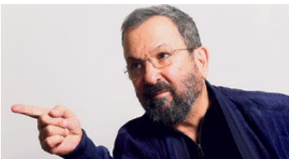
אהוד ברק שוקל קאמבק: עשוי להתמודד בראשות רשימה עצמאית 22:02 צבי זרחיה